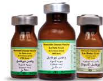
واکسن نیوکاسل سویه لاسوتا