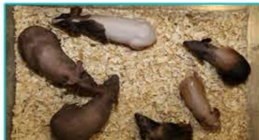
خوکچه هندی، نژادهای:

سوری (Syrian) در رنگهای سفید، دارچینی و طلایی