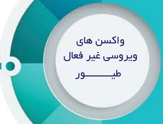
واکسن روغنی نیوکاسل (نیو رازی)