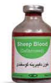
خون دفیبرینه گوسفندی