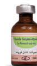
ادجوانت کامل فروند