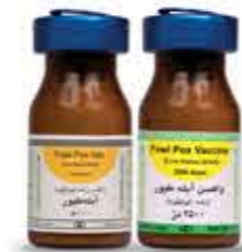
واکسن آبله طیور