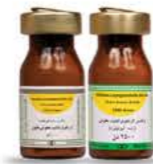
واکسن لارنگوتر اکتیبت عفونی