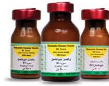
واکسن نیوکاسل سویه B1