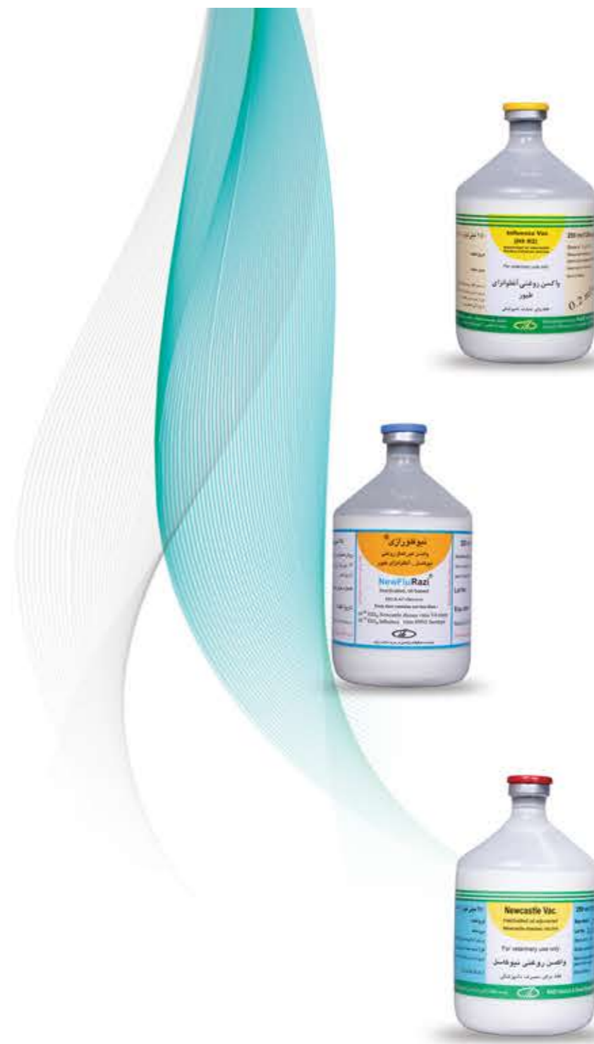
واکسن روغنی آنفلوانزا ای طیور (فلو رازی)

□ واکسن ویروسی زنده طیور (در مرحله آزمایش)