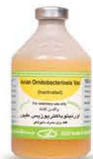
واکسن اور نیتوباکتریوزیس طیور