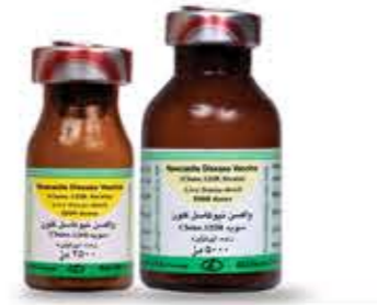
واکسن نیوکاسل کلون