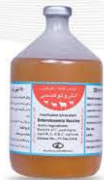
واکسن انتروتوکسمی (چهار ظرفیتی)