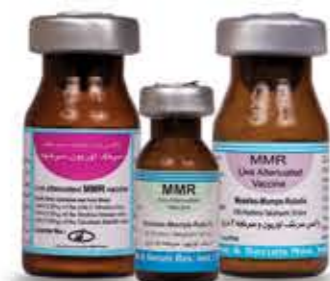
واکسن سرخک ، اوریون و سرخجه MMR