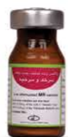
واکسن سرخک و سرخجه MR