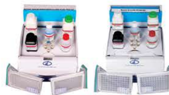
کیت های تشخیصی بروسلوز و یون