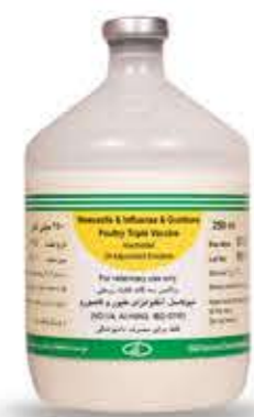
واکسن روغنی نیوکاسل، آنفلوانزا ای طیور و گامبور