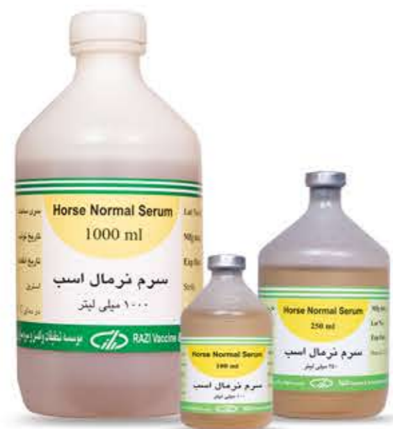
سرم نرمال اسب