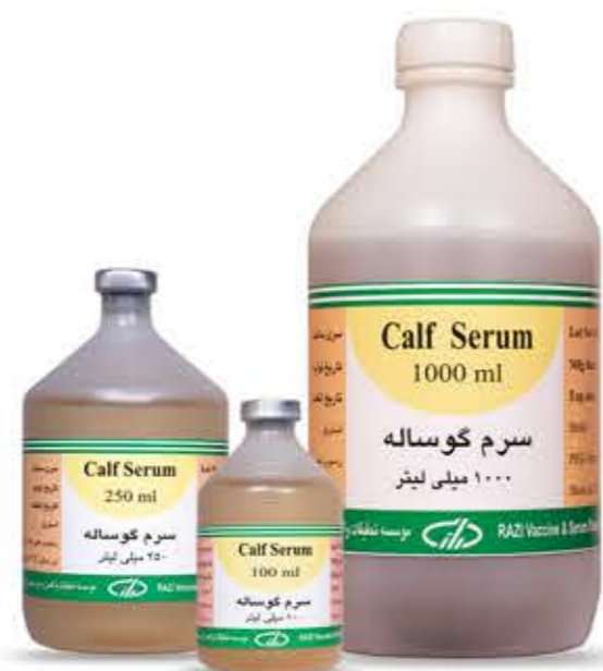
سرم نرمال گوساله

آنتی ژن ها، کیت های تشخیصی و سایر فرآورده های بیولوژیکی