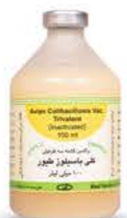
واکسن کلی باسیلوز طیور

□ واکسن های ویروسی غیر فعال طیور (در مرحله آزمایش)