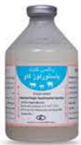
واکسن پاستورلوز گاو