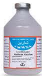
واکسن شاربن (سیاه زخم)