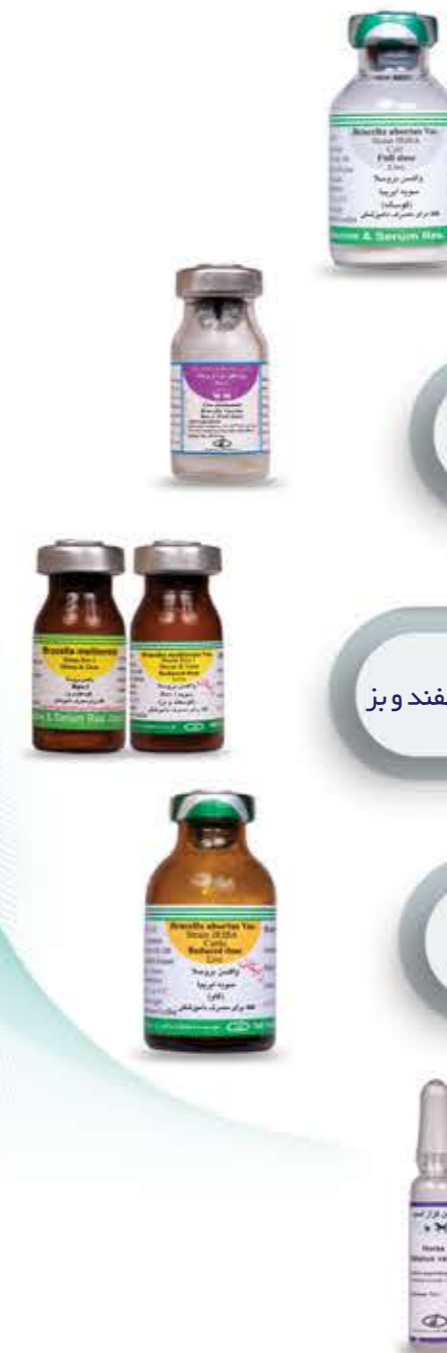
واکسن بروسلوز (گوساله)