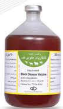
واکسن قانتاریای عفونی کبد