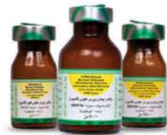
واکسن بورس عفونی (گامبورو)