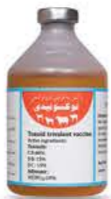
واکسن انتروتوکسمی (سه ظرفیتی)