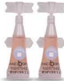
واکسن فلج اطفال دو ظرفی (BOPV)