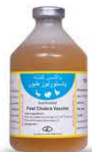
واکسن پاستور لوز طیور