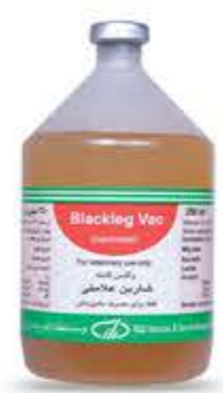
واکسن شاربن علامتی