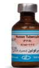
توبرکولین (مصرف انسانی)