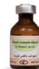
ادجوانت ناقص فروند